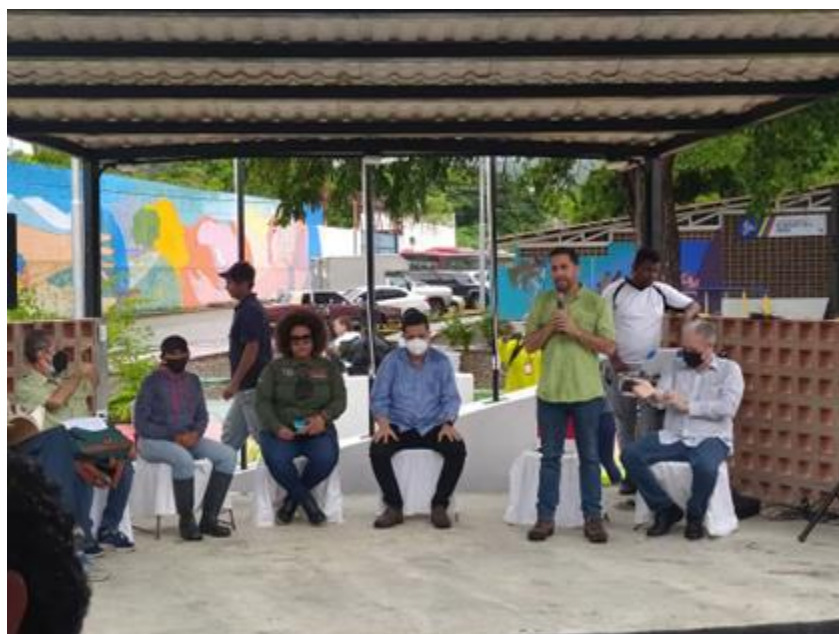
Foro sobre derecho a la ciudad.