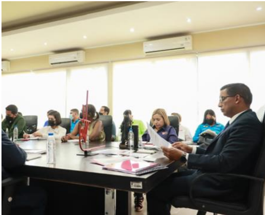
Órgano Superior de Vivienda.