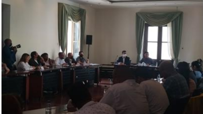
Participación en la Comisión de Desarrollo Social luego de la movilización del Movimiento de Pobladores.

28/06/22 Mesa de trabajo con la Coordinación de Redes Populares del Ministerio del Poder Popular para el Hábitat y la Vivienda en conjunto con delegadas y delegados estadales del Movimiento Viviendo Venezolano del III Congreso de Hábitat y Vivienda.