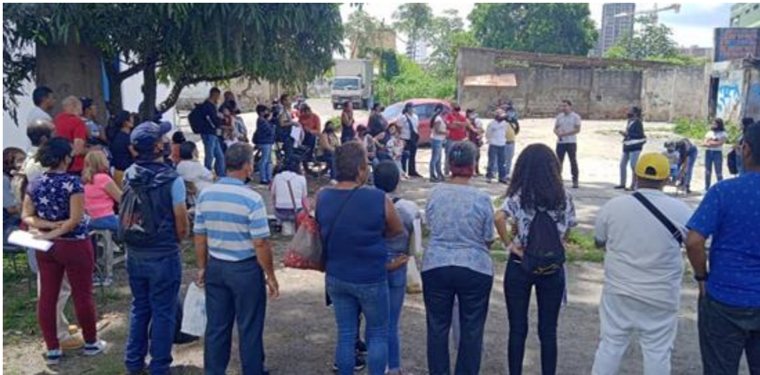
Asamblea con AVV de los Teques.