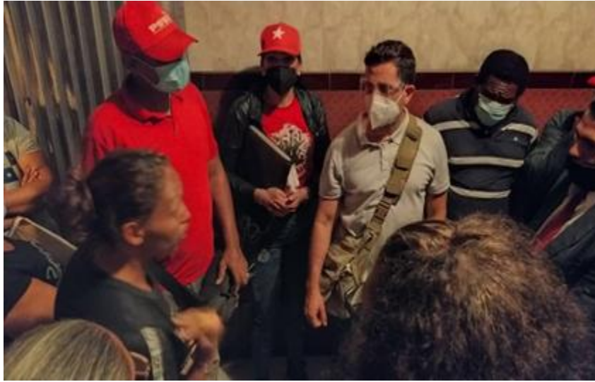
Inspección en pensión, pquia. San Agustín.