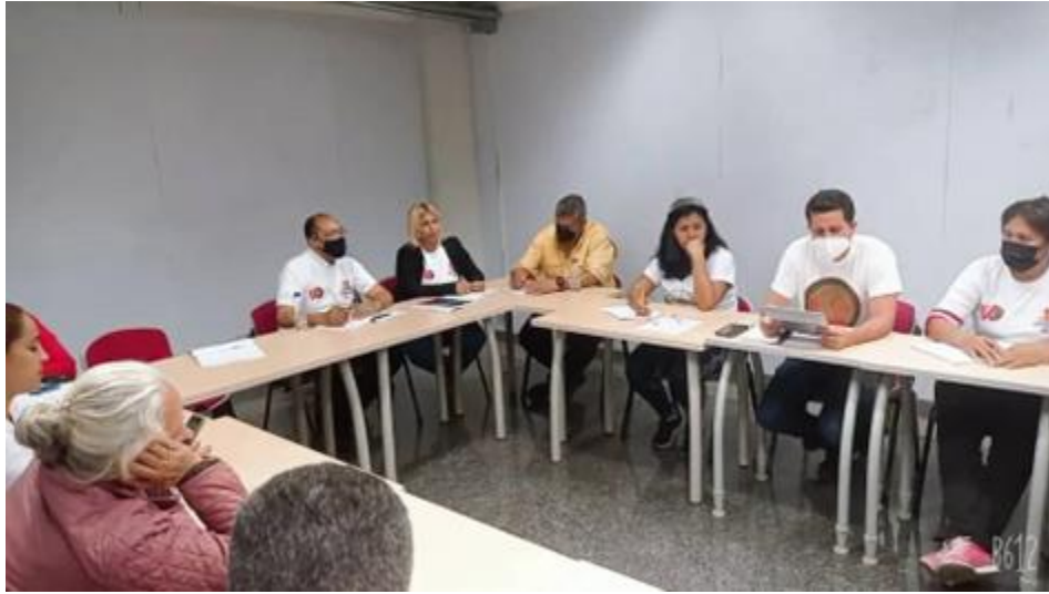
III Congreso Hábitat y Vivienda