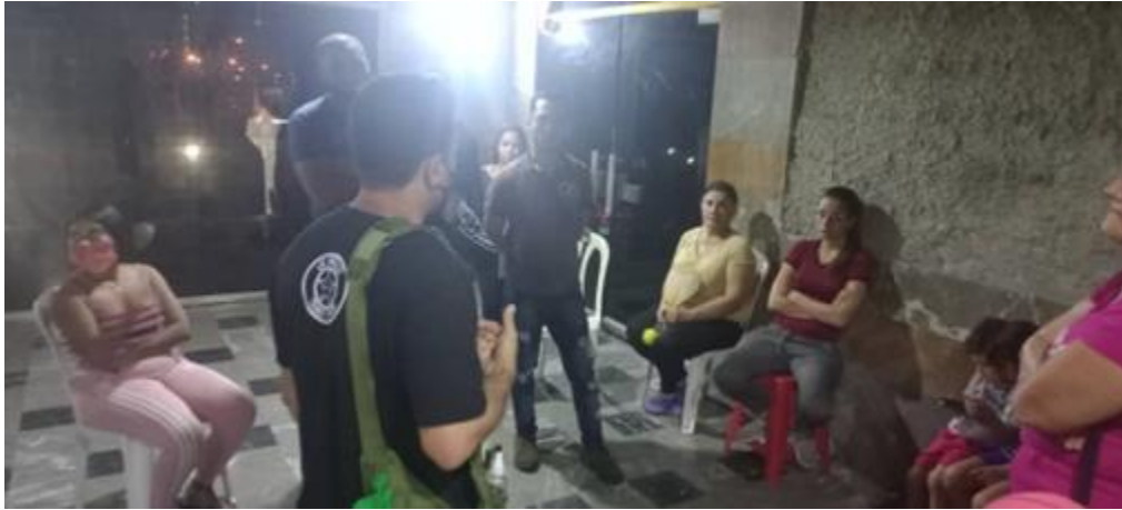
Visita a edificios de vieja data.