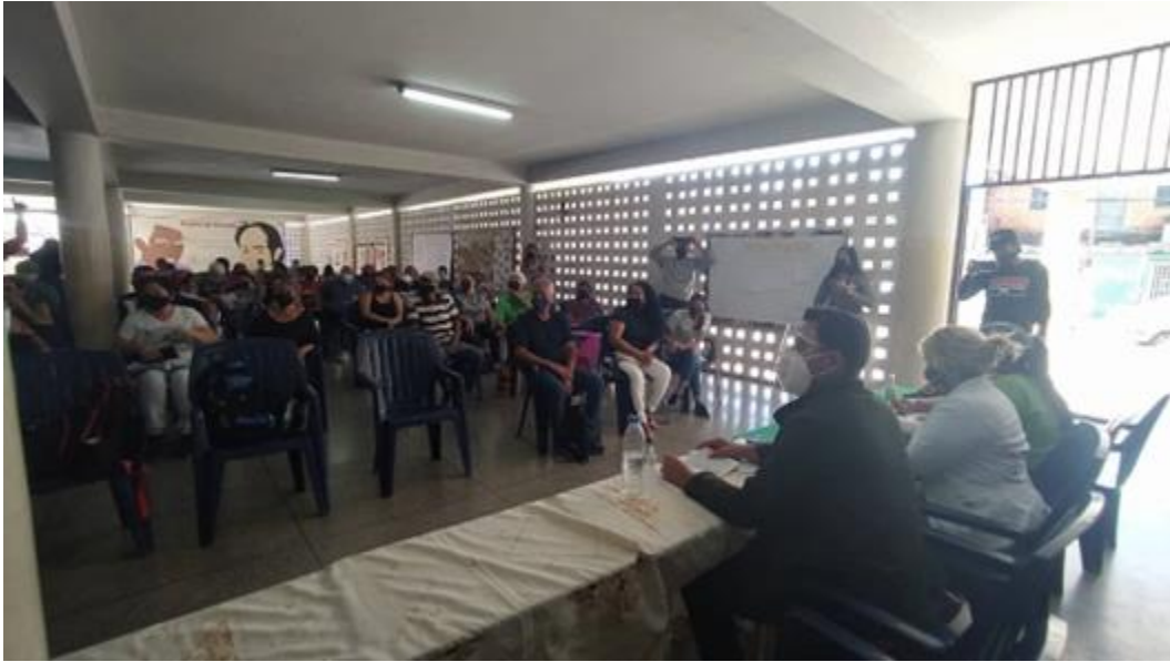
Asamblea de familias inquilinas, Edo. Aragua.