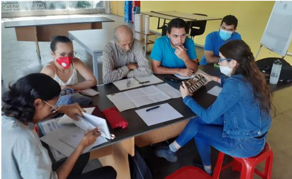
Mesa de trabajo MUSARQ.