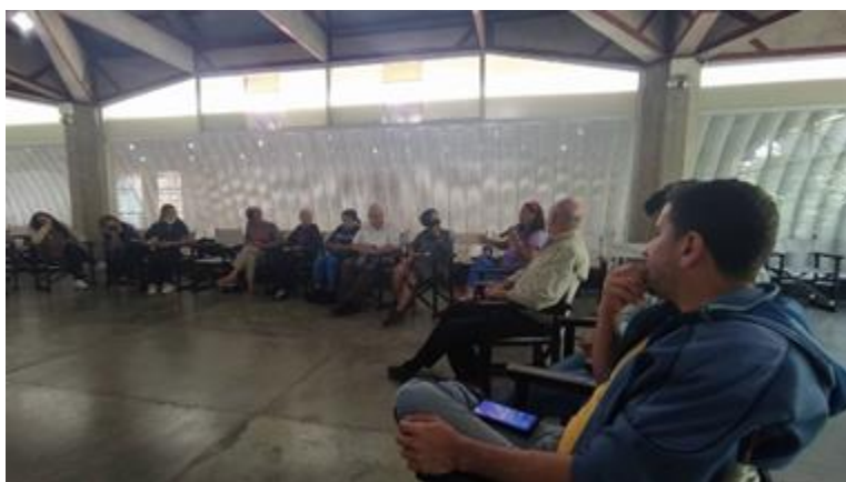
Observatorio sobre derecho a la ciudad