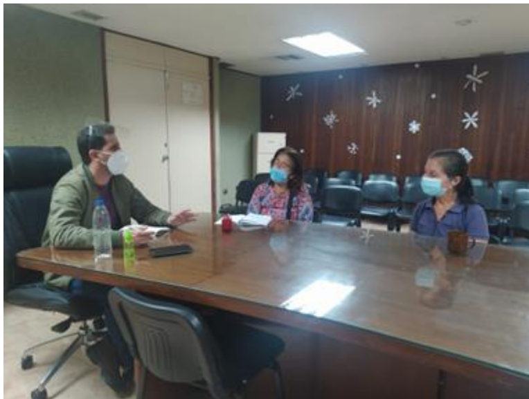
Atención a pequeños propietarios.