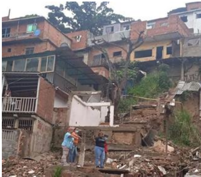
Acompañamiento en sector Caraballo pquia. San José por situación de deslizamientos.