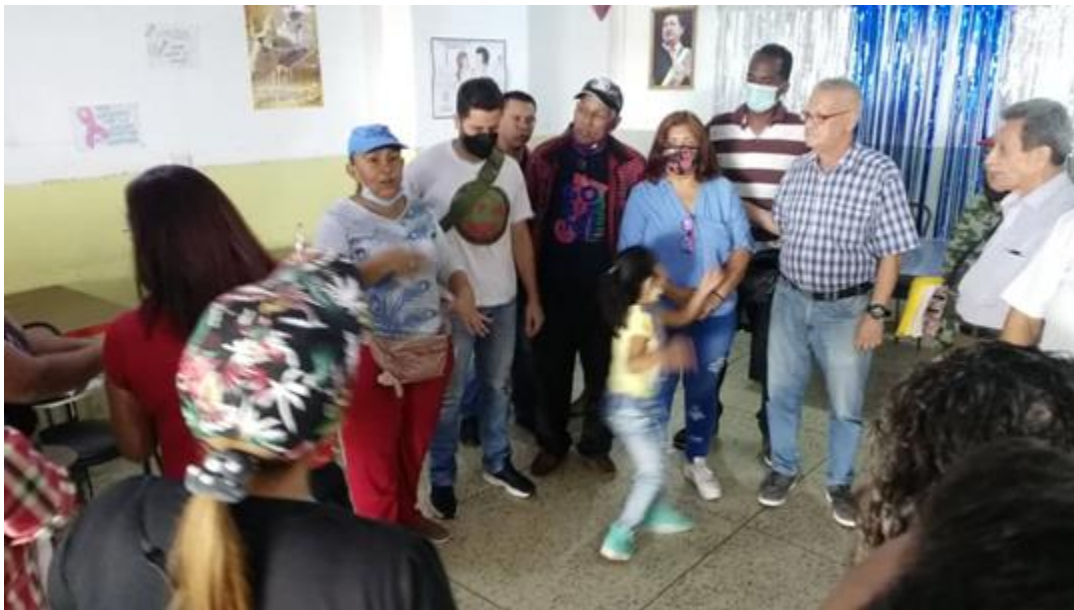
Asamblea con vocería de pensiones, pquia. San Juan.