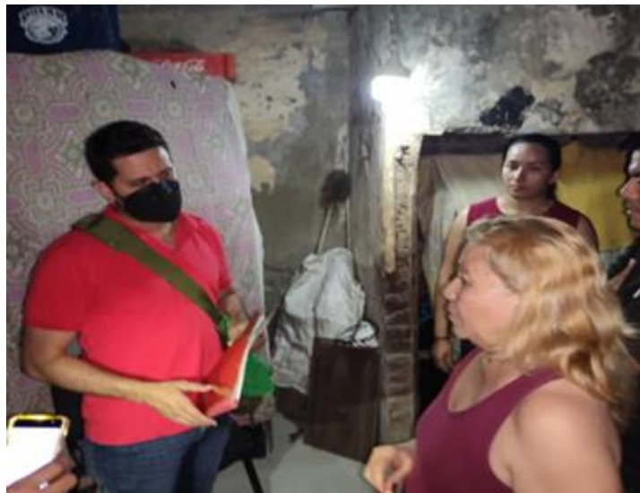
Inspección de viviendas, Estado Lara.