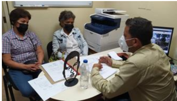
Atención a pequeñas propietarias de viviendas alquiladas.