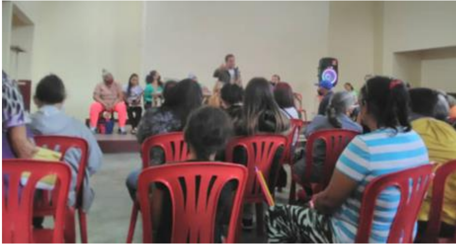
Despliegue III Congreso Hábitat y Vivienda