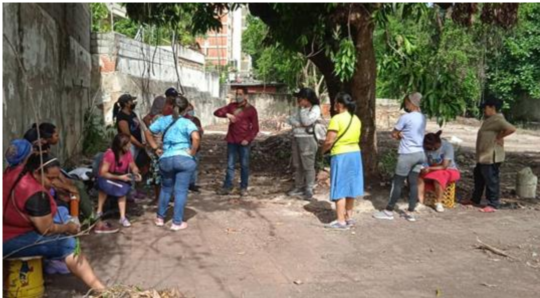
Acompañamiento AVV pquia. San Bernardino.