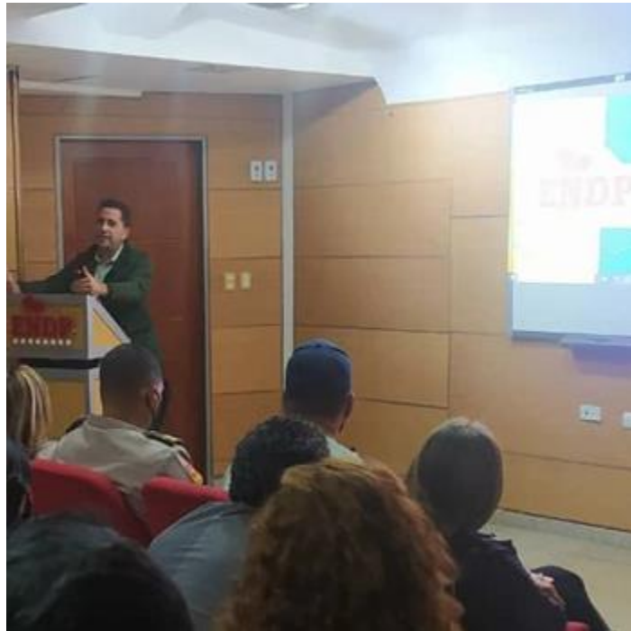
Formación sobre legislación contra desalojos arbitrarios