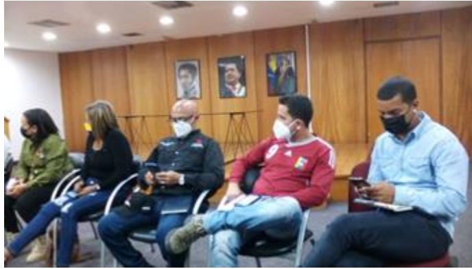
Órgano de Vivienda de Caracas.