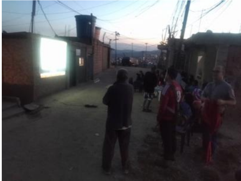
Proyección de documental, pquia. Sucre.