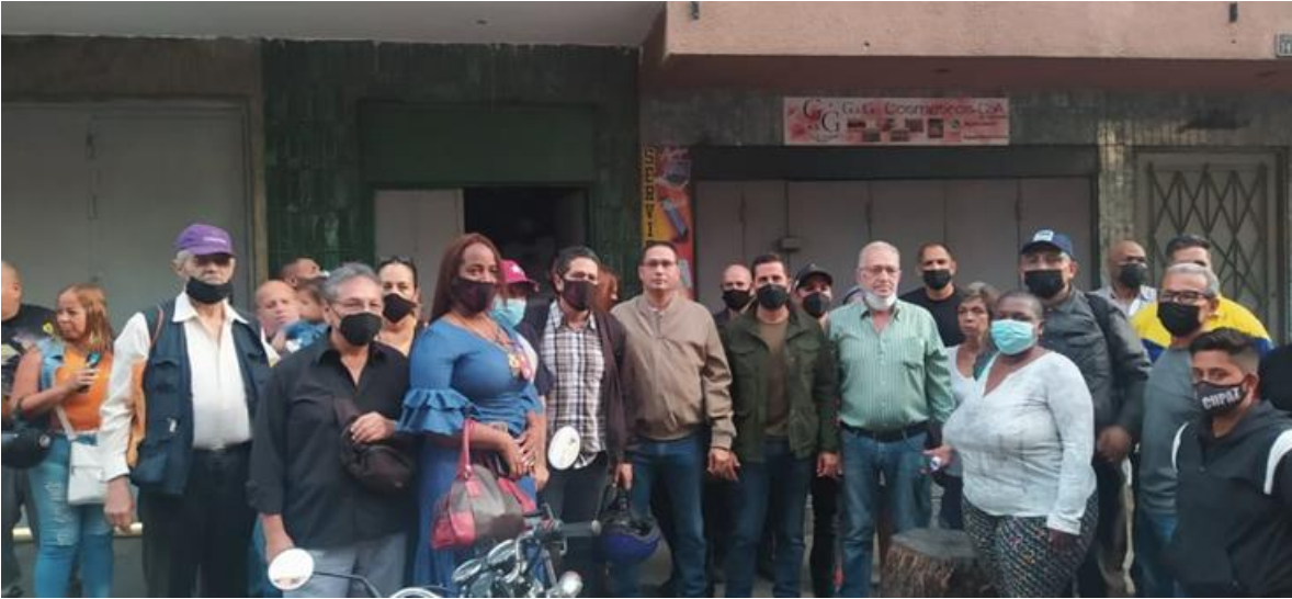
Inspección conjunta por desalojo arbitrario.