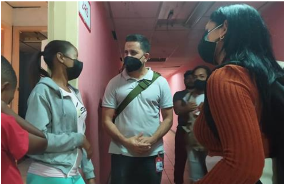
Inspección en refugio Pumarrosa, pquia. Sucre.