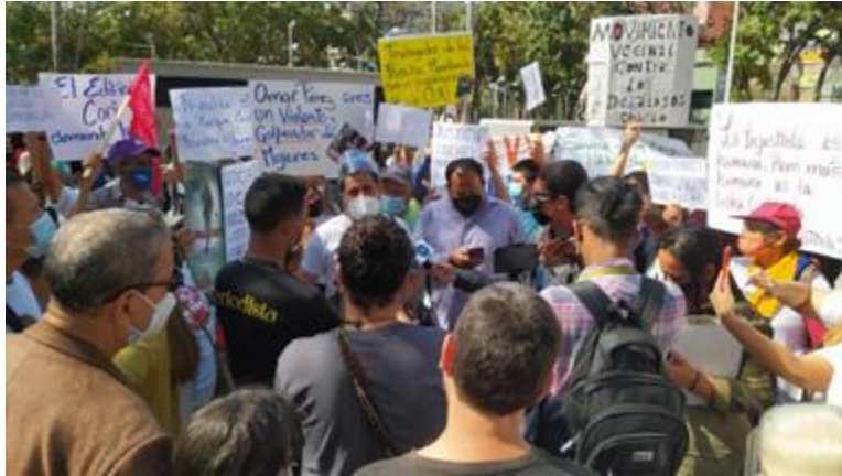
Movilización Ministerio Público por criminalización hacia inquilinos.