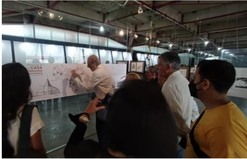
Exposición vivienda indígena, MUSARQ