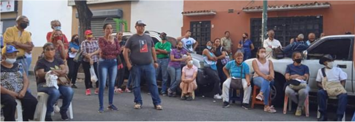
Cabildo abierto por cambio de ordenanzas y variables urbanas, Municipio Chacao.