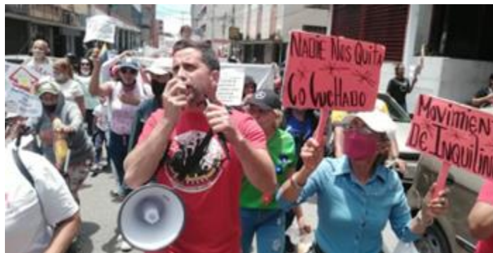
Movilización Estado Lara.