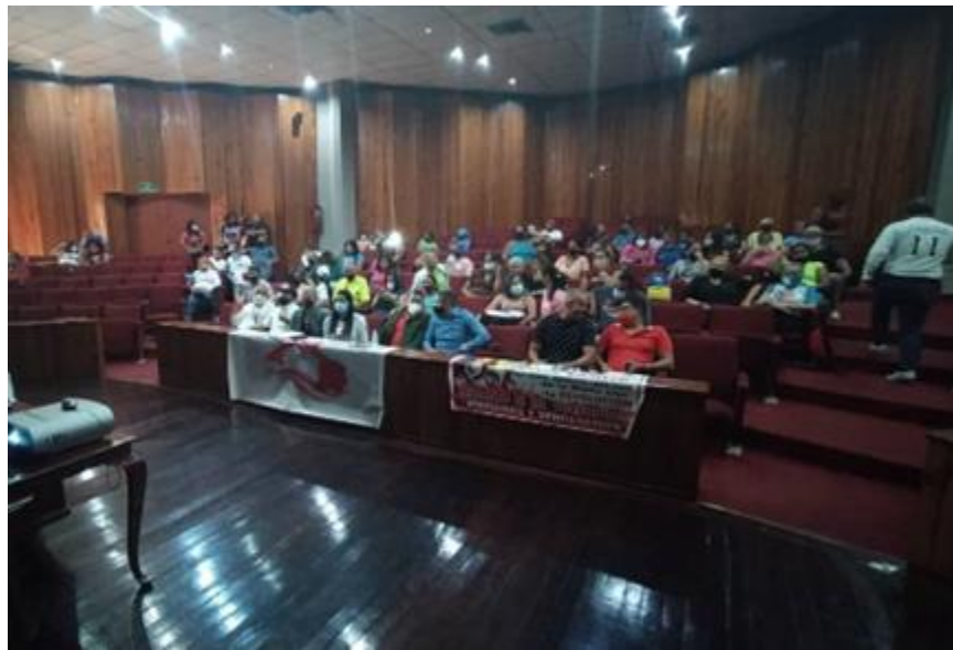
Asamblea con vocerías de AVV Edo. Aragua.