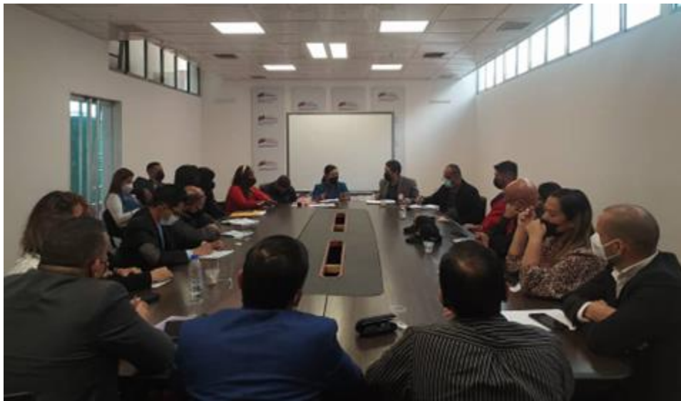
Mesa de trabajo por desalojo arbitrario.