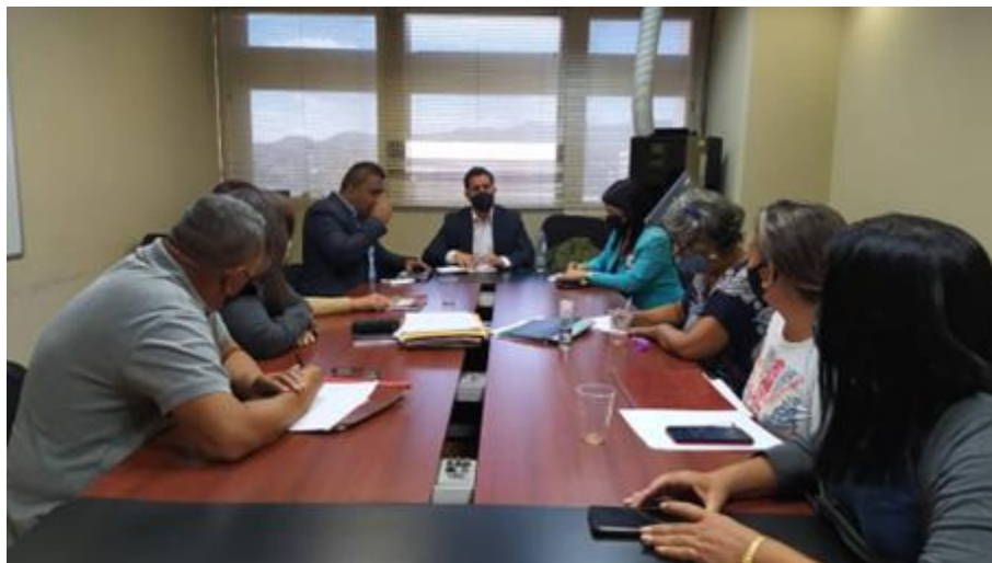
Atención AVVs del Estado Carabobo.