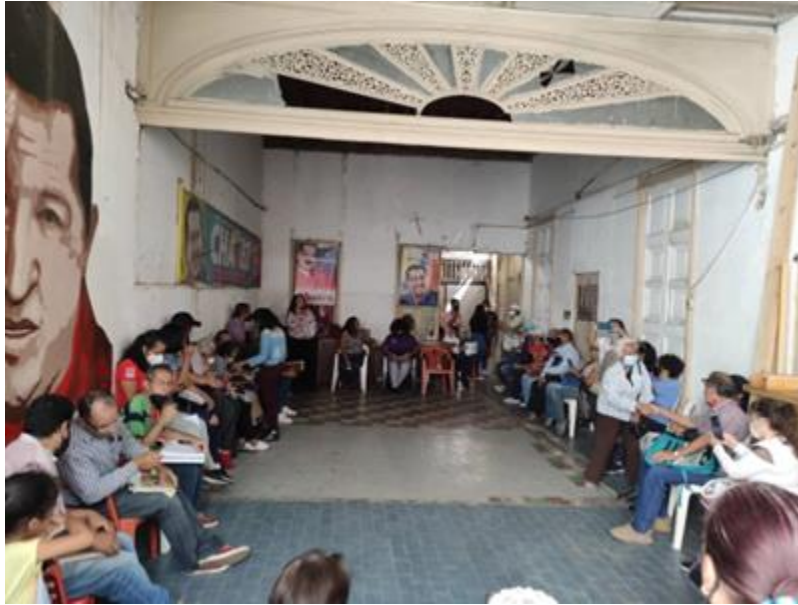
Asamblea CTUs Caracas.