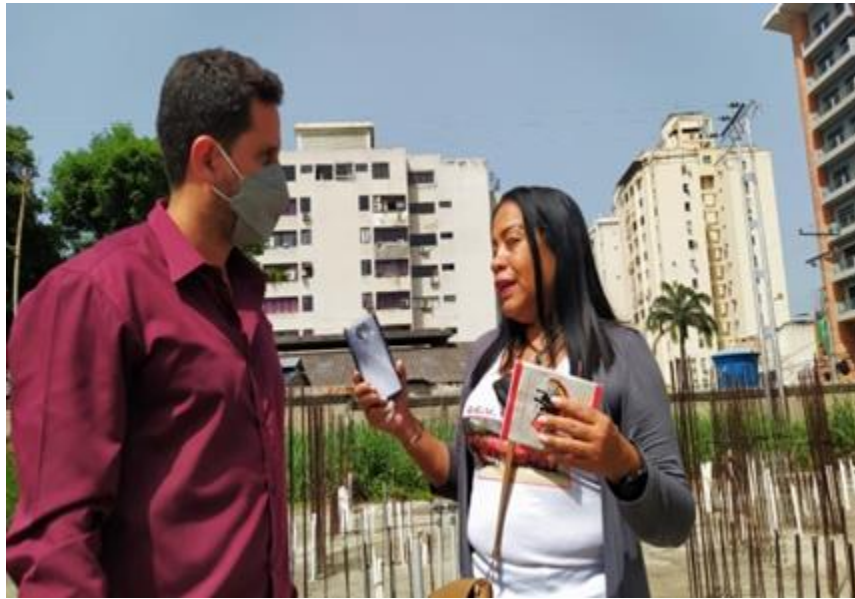
Inspecciones terrenos AVV Carabobo