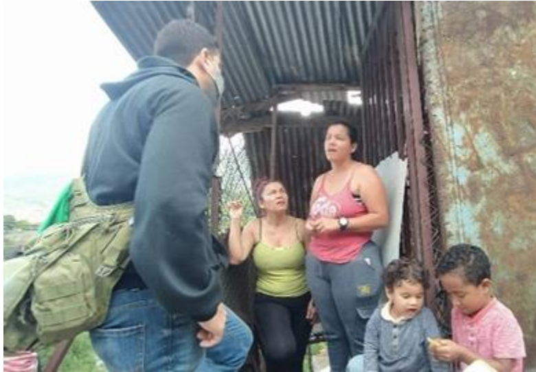
Recorrido Sector la Florencia parte alta, Estado Miranda.