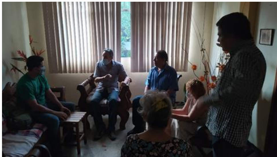
Visitas a inmuebles de vieja data