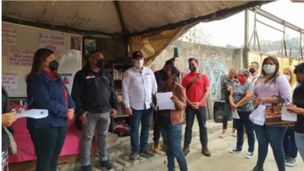
Asamblea en AVV El Arañero de Sabaneta, pquia. San Pedro.