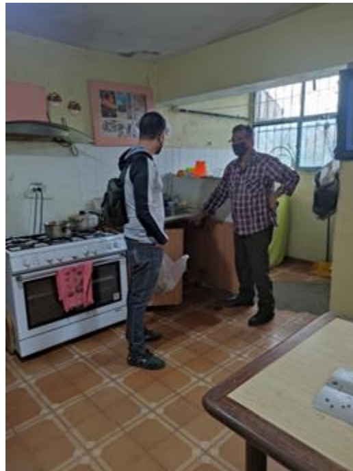
Inspección Vivienda, Caricua.