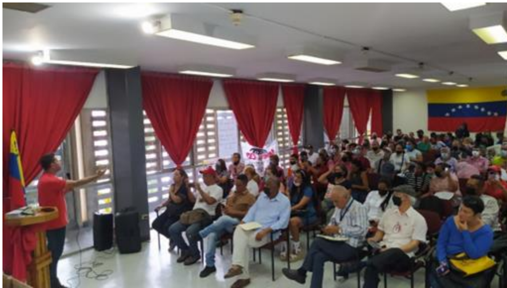
Asamblea Estado Carabobo.