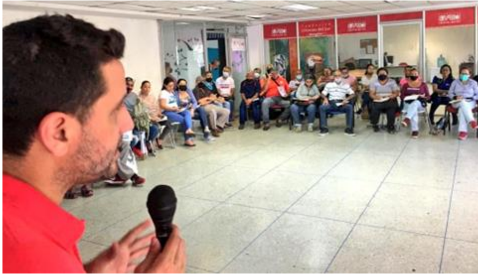
Foro en Lara.