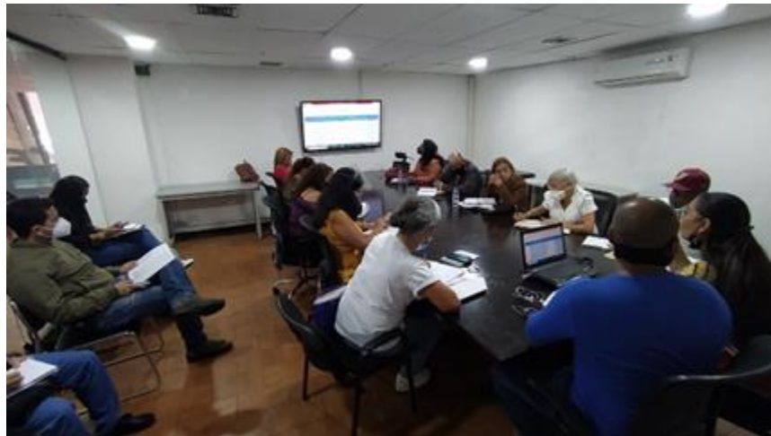
Mesa de trabajo con AVVs y MINHVI