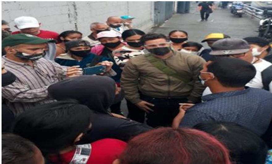
Acompañamiento AVV "La Esponja", pquia. San José.